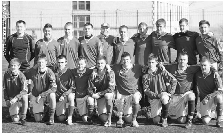
ФЛ. ЗОНА «ЧЕРНОЗЕМЬЕ»