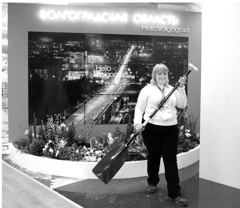
Девушка с веслом по-волгоградски