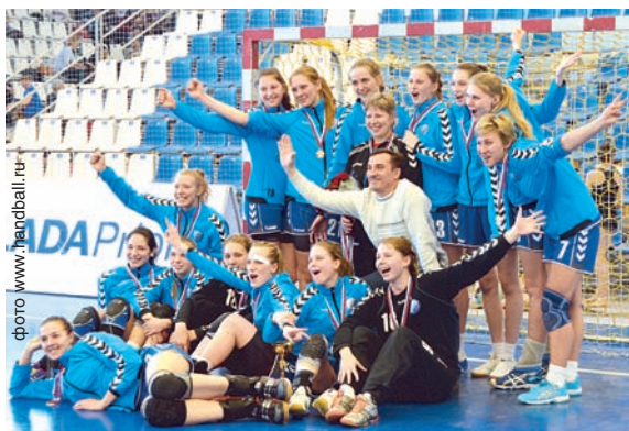
Чемпионский состав динамовок

ского титула прошлогоднего первенства волгоградки пошли на повышение и впервые с 2011 года завоевали «золото» турнира дублеров.